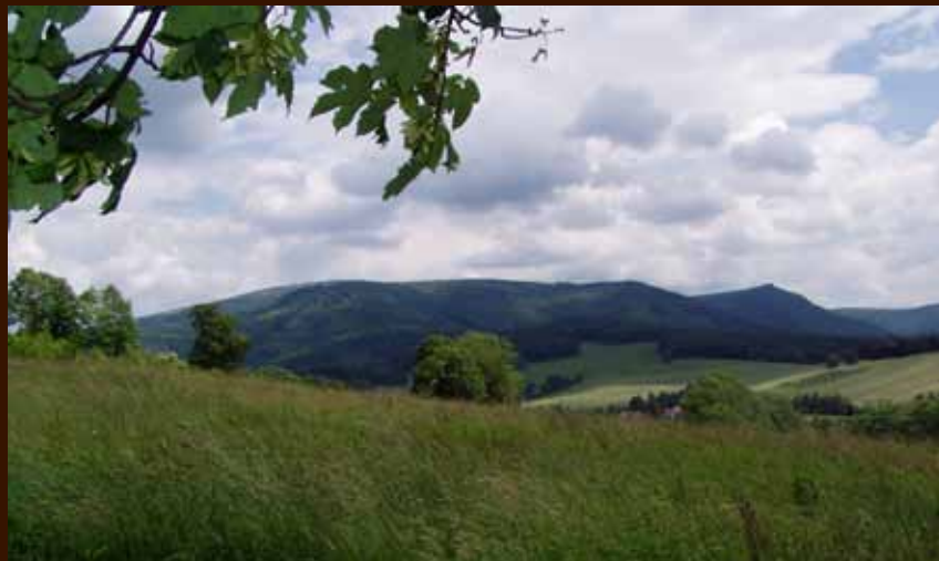
Pohled na horu Smrk.

Singltreku pod Smrkem se nachází ve frýdlantském výběžku, vlně úbočím hory Smrk (1124 m. n.m.), nejvyšší hory české části Jizerských hor. V místě, které odedávna patřilo k nejchladnějším a nejméně přístupným oblastem českých zemí. Střetávala se zde kultura lužickosrbská s německou a českou.