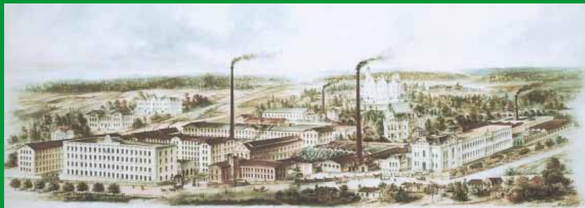
Pohled na továrnu Ignaze Klingera z konce 19. století.

Ke městskému znaku získalo město i další privilegia. Mimo horního práva patřilo ke právům města právo trhů, právo výčepu piva, právo koupací a právo šesti řeznictví. Od roku 2009 je zde i právo singltrekové.