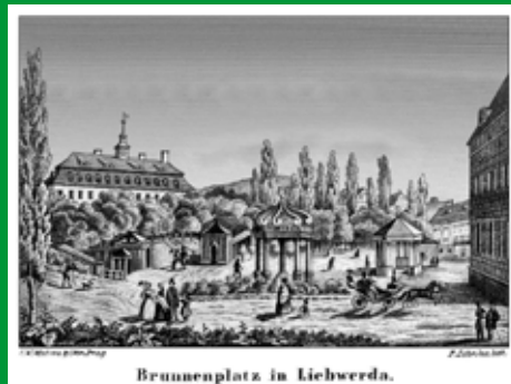
Pohled na lázeňskou kolonádu z konce 18. století.

První zmínky o obci sahají do II. poloviny 14. století.